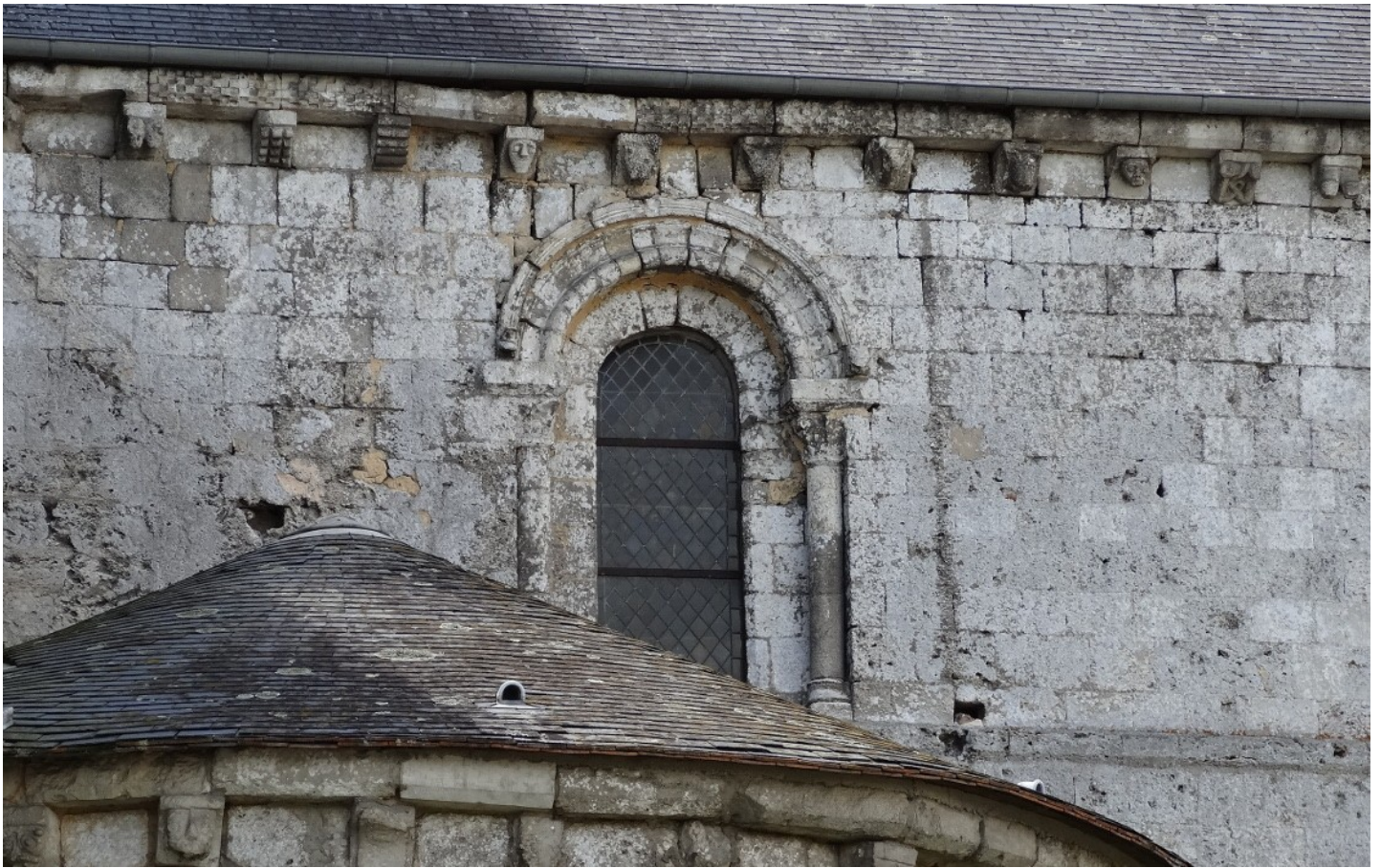
Photographie du monument historique